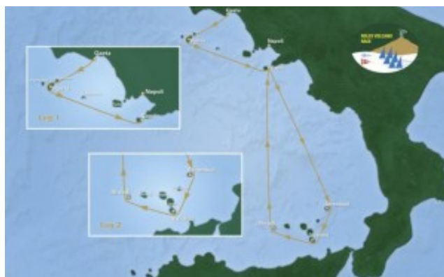
Карта маршрута Volcano Race

Регата Volcano Race свое название получила из-за необычной дистанции, во время прохождения которой необходимо обогнуть множество вулканических островов, включая знаменитый действующий вулкан Стромболи. По древнему преданию именно здесь, в островах Эола, проживает бог ветра Эол, и древние люди верили, что именно здесь рождается ветер.